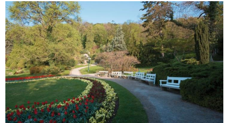
Kurpark Baden

4. Zeichne die Schwechat und den Mühlbach mit einem bunten Stift nach.