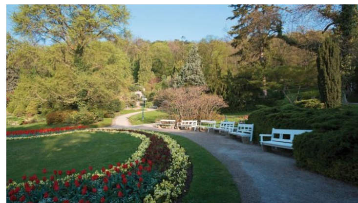
Kurpark Baden: Archiv der Geschäftsgruppe Tourismus der Stadtgemeinde Baden, 2014

4. Zeichne die Schwechat und den Mühlbach mit einem bunten Stift nach.