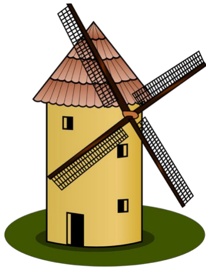
Mühle: Clker-Free-Vector- Images, 2014

5. Hast du dir gemerkt, wofür der Mühlbach früher genutzt wurde? Kreuze an, ob die Aussage richtig oder falsch ist.